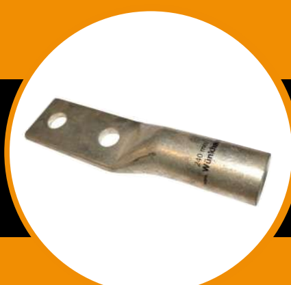
TERMINALES PARA CABLES DE COBRE